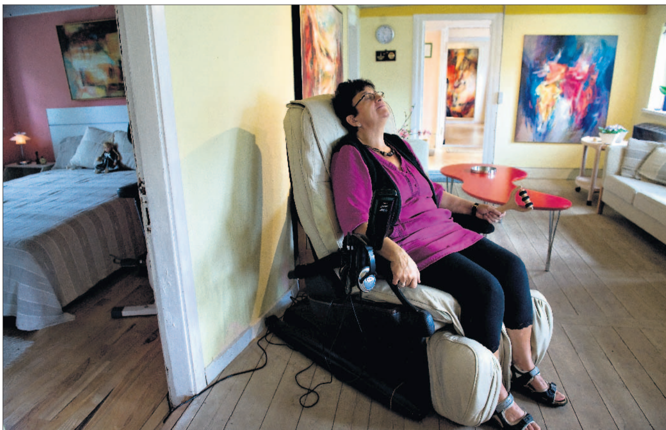
INDENDØRS AFSLAPNING. Det er hårdt og anstrengende at stå og male hele dagen, så en tur i massagestolen kan være påkrævet.